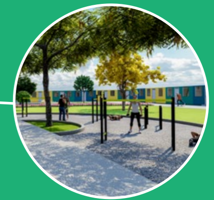
Gimnasio al aire libre