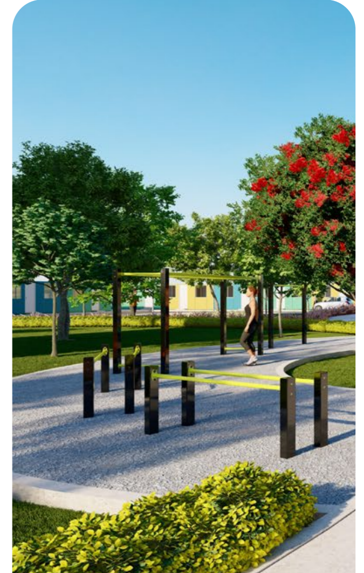
Gimnasio al aire libre