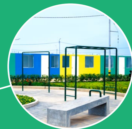
Gimnasio al aire libre