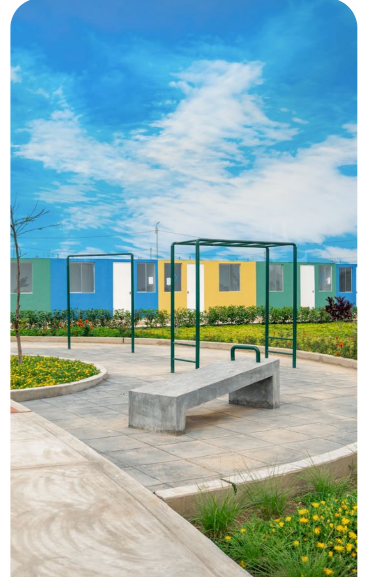
Gimnasio al aire libre